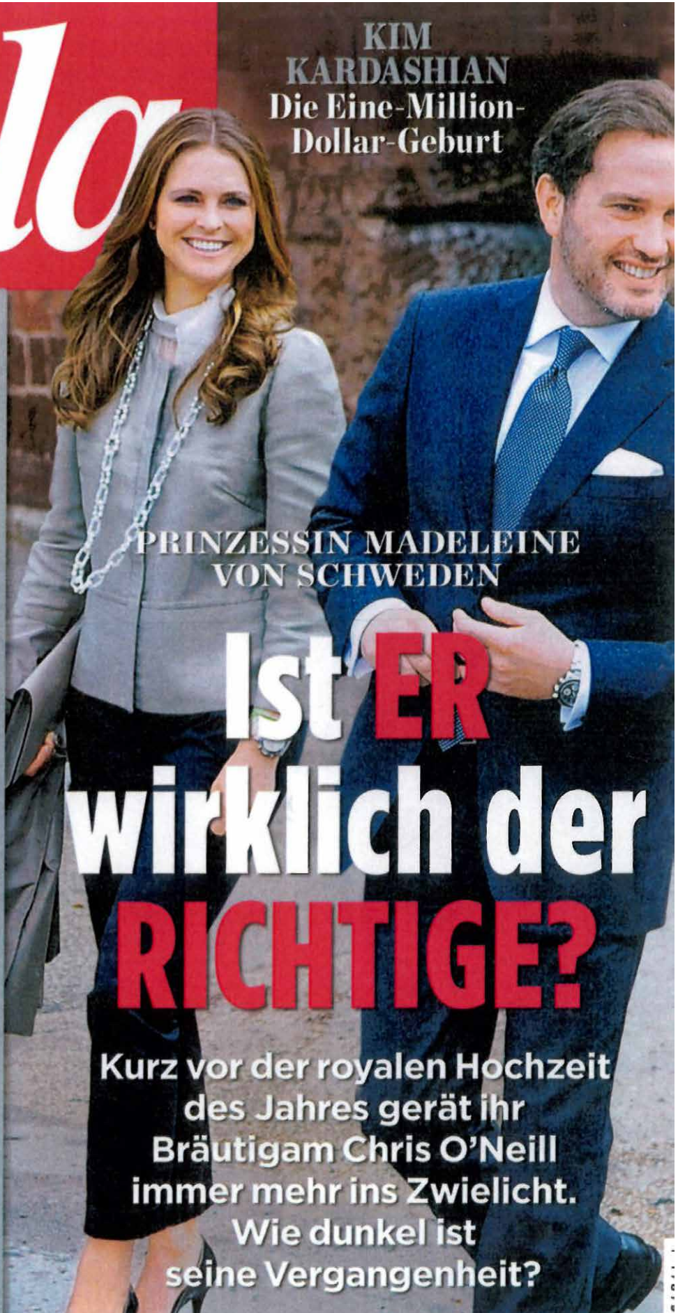
PRINZESSIN MADELEINE VON SCHWEDEN