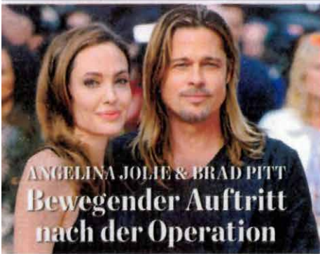
ANGELINA JOLIE & BRAD PITT Bewegender Auftritt nach der Operation

KIM KARDASHIAN Die Eine-Million-Dollar-Geburt