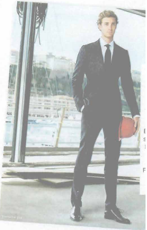
Pierre Casiraghi, initiated by Jacky Ickx