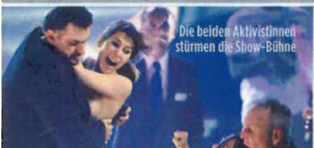
Die beiden Aktivistinnen stürmen die Show-Bühne

EXKLUSIV Nackte Femen-Rebellin ist CDU- Politikerin